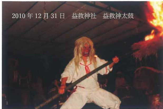
2010年12月31日 益救神社 益救神太鼓

そして1984年4月、町が進める林地活用計画と並行し、屋久島にふさわしい祭りの創造と太鼓のオリジナル曲のシナリオを創るための検討会を、町企画課、町商工会、屋久島太鼓保存会で立ち上げました。翌年5月には祭りの名称を「ご神山まつり」、太鼓の名称を「益救神太鼓」と決定しました。