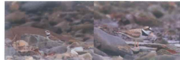
2羽のコチドリ。左は頭の黒帯が薄いので幼鳥と思われる。親子だろうか？ 2022.7.2 春田海岸

う広い遠浅の泥地帯が少なく、一定期間ずっと滞在するのは不向きなのだろうか。たまに見ることがあるがずっといる鳥は多くないと感じる。そんな中でも、この夏コチドリの親子がいると聞いた。図鑑では九州以北では夏鳥とあり、もしかすると繁殖のために北上していたうちの少数が屋久島にとどまって繁殖したのかもしれない。