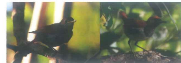
アカヒゲ幼鳥 2021.8.28 小瀬田 アカヒゲ若オス 2021.9.8 楠川

り、いつか出会えると信じてきた。そしてやっと、昨年5月にははっきりとしたさえずりを、8・9月には幼鳥の姿を確認できた。