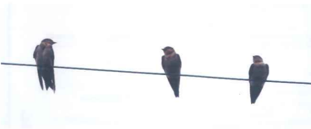
リュウキュウツバメの成鳥(左、真ん中)と巣立ち雛(右) 2022.7.6 中間

ツバメ類では、ツバメが長い期間確認できている。昔は通過していくだけで、屋久島では繁殖は確認されていなかったようだが、現在安房で営巣も確認されるので夏鳥として滞在しているのもいると思われる。もしかしたら越冬しているのもいるかもしれない。ツバメの群れに混じってコシアカツバメやアカハラツバメ、イワツバメも時々見られる。2～3月に島の南部ではリュウキュウツバメが見られた。今年の7月にもリュウキュウツバメの親子と思われるグループも見られたので、おそらく営巣して繁殖していると思われる。冬の間もずっといる留鳥なのか、島の南部まで足を運んで歩いてみたい。