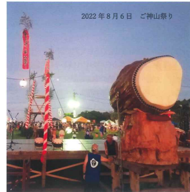
2022年8月6日 ご神山祭り

この大太鼓が青森の浪岡町で披露されたことがあります。浪岡町とは、交換留学生を通じて交流があり、夏祭りに招待されたのでした。これが初めて「屋久杉の大太鼓・神鼓」が島外で披露された時でした。