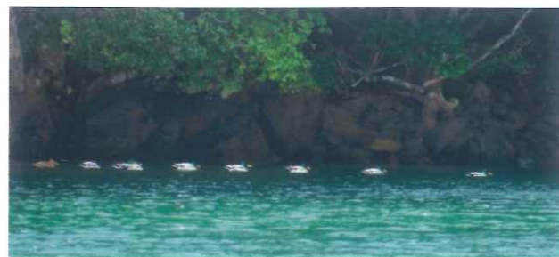
マガモの群れ 2018.1.24 安房川

目録で冬鳥となっているものにカモ類ではオンドリがある。オンドリはずっといるというよりはたまに見られるような認識だ。むしろ、目録では旅鳥となっているカルガモやマガモの方が冬鳥の印象がある。