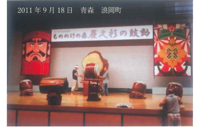
2011年9月18日 青森 浪岡町

祭りでは、4トントラックに載せた太鼓を打ち鳴らしながら浪岡町内をパレードしました。その翌年は、「ご神山祭り」に浪岡町から「ねぶた」を携えてたくさんの方々が来てくださり、みんなでハネトとなり、踊り明かしました。その後も屋久島から2回行き、浪岡町から2回来ていただき未だに交流を深めています。